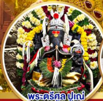
พระตรีศูล ปูणे (Trishul Pune)