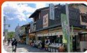
ช้อปปิ้งถนนสายชาเขียว