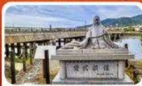
สะพานอูจิ