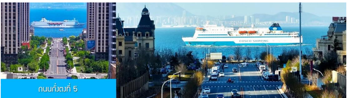
ถนนกว้างที่ 5

จากนั้นนำท่านเที่ยวชม สวนน้ำเมืองเวนิสตะวันออก 大连东方威尼斯城 เป็นเมืองเวนิสจำลองที่ถูกสร้างขึ้นด้วยทุนกว่า 8,000 ล้านดอลลาร์ ออกแบบโดยบริษัท ARC จากประเทศฝรั่งเศส โดยจำลองผังเมืองเวนิสในประเทศอิตาลี บนพื้นที่กว่า 400,000 ตารางเมตร ประกอบด้วยคลองเวนิสและอาคารที่มีสถาปัตยกรรมแบบตะวันตกกว่า 200 หลัง มีบริการล่องเรือคอนโดล่าแก่นักท่องเที่ยว นำท่านเดินชม ถ่ายภาพที่ระลึกท่ามกลาง