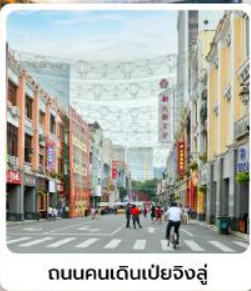
ถนนคนเดินเป่ย์จิงลู่