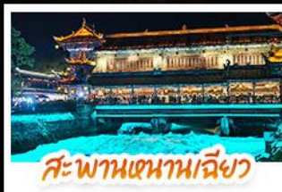
สะพานเสฉวนเฉียว