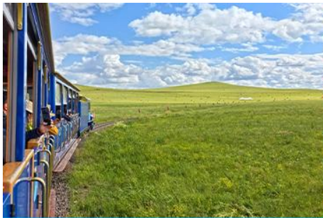
ชมบ้านชาวมองโก

เที่ยง รับประทานอาหารกลางวัน ณ ภัตตาคาร (14)