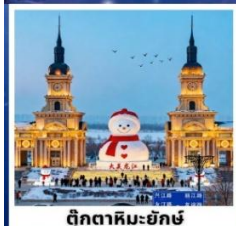
ตึกตาคิมะฮักซ์