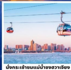
นั่งกระเช้าชมแม่น้ำชองฮวาเจียง