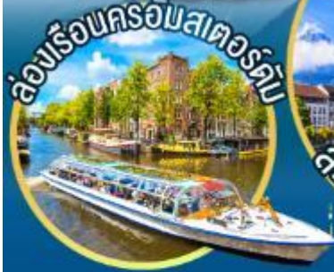
ล่องเรือชมเมืองแห่งสายน้ำ นครอัมสเตอร์ดัม