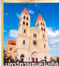
มหาวิหารเซนต์ไมเคิล