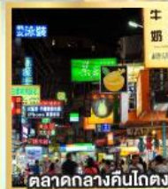
ตลาดกลางคืนโกตง