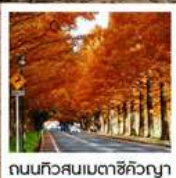
ถนนทิวสนเมตาชิคิวญา