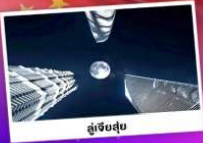
ดูเจ็ยสูย