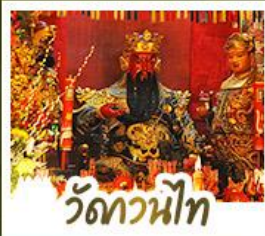
ว้ดกวนน้ีท