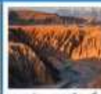
อุทยานคานาสือ