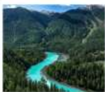
อุทยานคานาสือ