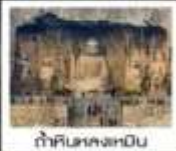
ตำหนักหลงเหมิน