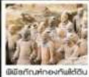
พิพิธภัณฑ์ทหารขี้ผึ้งดิน