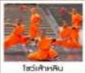
โชว์เจ้าหลิม