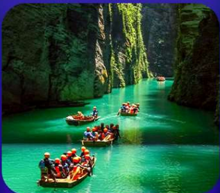
“ ผิงซานแกรนด์แคนยอน ”