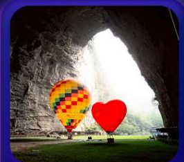
“ ถ้าถึงหลง ”