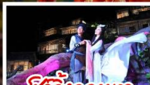
ชีวิตจิ้งจอกขาว