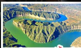
แกรนด์แคนยอนแม่น้ำเหลือง