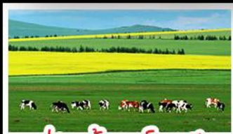
ทุ่งหญ้าเออร์ดอส

ทุ่งหญ้าเออร์ดอส สุสานเจกิสซ่าน แกรนด์แคนยอนแม่น้ำเหลือง