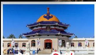
สุสานเจกิสซ่าน