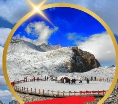
OPTIONAL TOUR ธารน้ำแข็งท่ากู่ปิงชวน