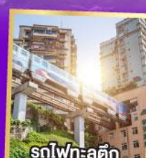
รถไฟฟ้า: ลูตึก