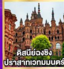
คิสบีย้งฉงชิ่ง ปราสาทเวทมนตร์