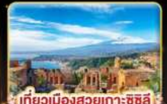
เที่ยวเมืองสวยเกาะซซิลี Taormina