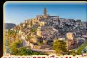
ตามรอย 007 เมือง Matera