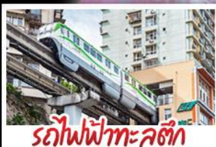
รถไฟฟ้าทะเลตุ๊ก