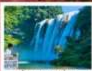
น้ำตกหวงทิวซู