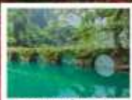
อุทยานเสี่ยวซีหลง