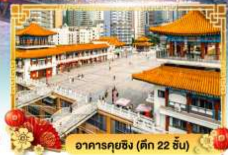
อาคารคิงซิง (ตึก 22 ชั้น)