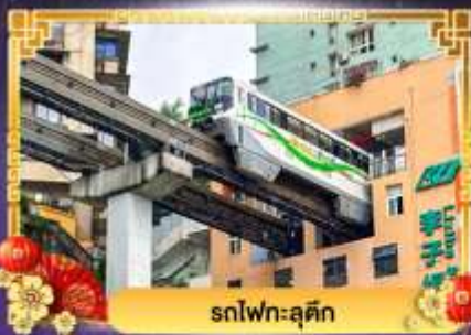
รถไฟฟ้าลัดดีค