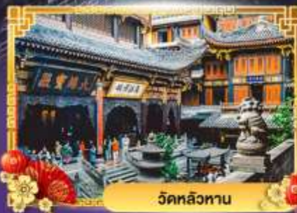
วัดหลิวทาน