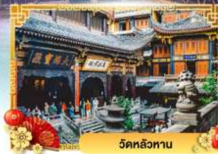
วัดหลัวหลาน