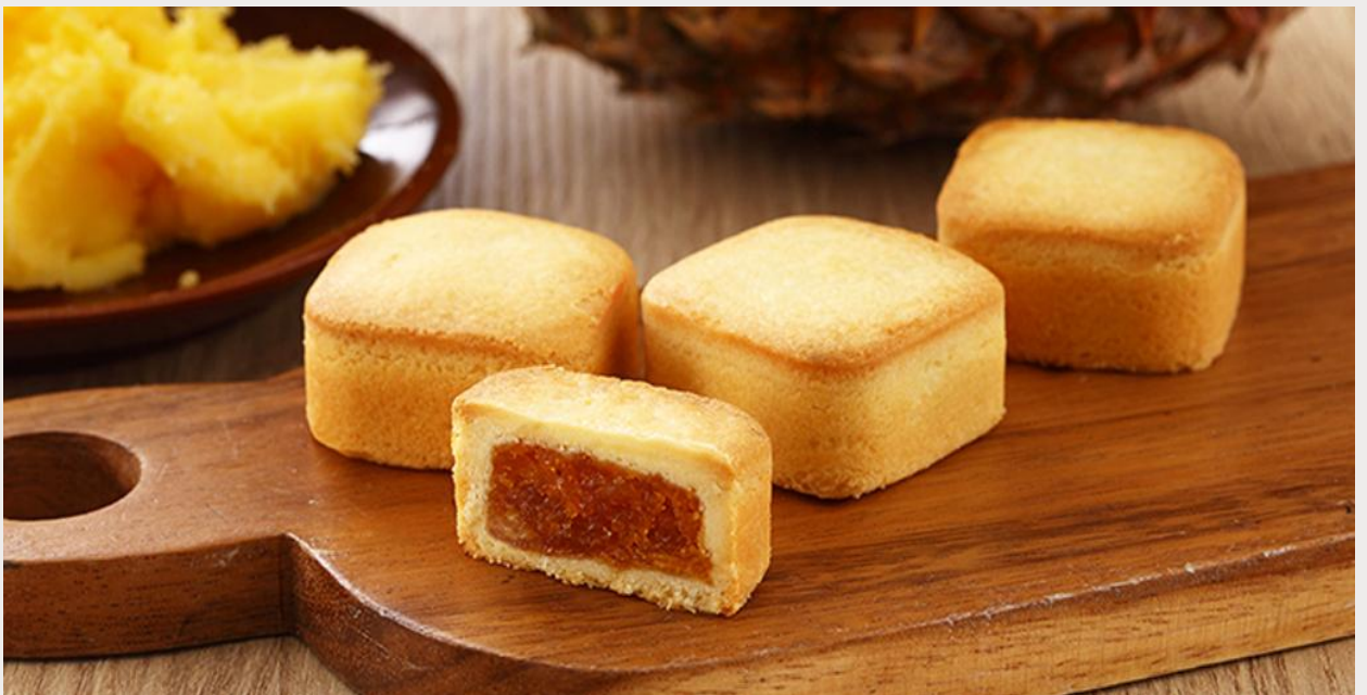
ร้านขนมพายสับปะรด (Taiwanese Pineapple Cake)

นำทุกท่านแวะชิม ร้านขนมพายสับปะรด (Taiwanese Pineapple Cake) ขนมที่ถือได้ว่ามีแหล่งกำเนิดมาจากเกาะไต้หวัน เนื้อแป้งหอมเนยห่อหุ้มแยมสับปะรด รสชาติมีความหวาน และความมันของเนยเล็กน้อย ผสมกับรสเปรี้ยวของสับปะรด ทำให้มีรสชาติที่กลมกล่อมจนเป็นที่นิยม ด้วยรสชาติที่เป็นเอกลักษณ์ไม่เหมือนใคร ทำให้ขนมพายสับปะรดเป็นขนมที่ขึ้นชื่อของเกาะไต้หวัน ไม่ว่าจะใครที่ได้มาเยือนก็ต้องซื้อเป็นของฝากติดมือกลับบ้าน นอกจากขนมพายสับปะรดแล้ว ยังมีขนมอีกมากมายให้เลือกชิม และเลือกซื้อ เช่น ขนมพระอาทิตย์ ขนมพายเผือก เป็นต้น อีสาระให้ทุกท่านเดินเลือกซื้อขนม