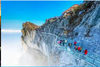
ระเบียงทางเดินกระจกเลียบนหน้าผา