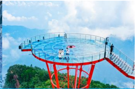
ระเบียงชมวิว Sky Eye

วันที่ 1 พิพิธภัณฑภาพเขียนหินทราย-ศูนย์ผลิตภัณฑ์ที่ทำจากยางพารา – กระจ่าขึ้นเขาเจ็ดดาว – ระเบียงแก้วเลียบนหน้าผา ระเบียงชมวิว SKY EYE – (ไกด์นำเสนอโปรแกรมเสริม ชุดโชว์จิ้งจอกขาว)