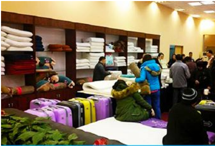
ศูนย์จำหน่ายผลิตภัณฑ์ยาวพารา