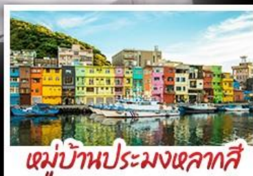
หมู่บ้านประมงเหลากสี