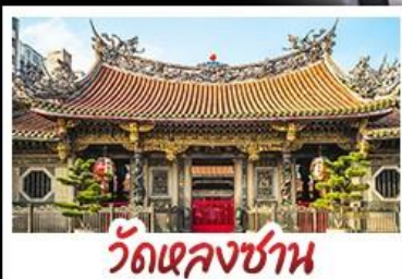
วัดเจหลงซาน