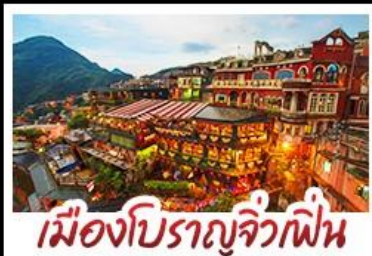
เมืองโบราณจีวเฟิน