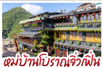
หมู่บ้านปิศาจจิ้งจิก