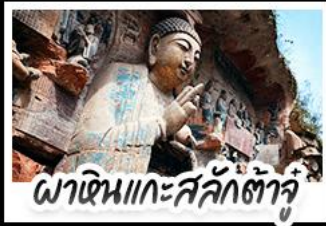
พาคินแกะสลักต้าจู่