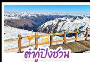
ต้ากู่ปิงชวณ