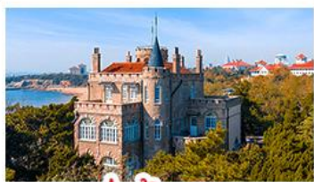
ป่าตึกวน

พระราชวังฤดูร้อน - วิวเมืองซิงเต่า รถไฟความเร็วสูง - ภูเขาเหลาซาน กำแพงเมืองจีนด่านจวิยงกวน - ป่าตึกวน พักโรงแรมระดับ 4 ดาว - ไม่ลงร้านช้อปปิ้ง มือพิเศษ เปิดปักกิ่ง, หม้อไฟซีฟู้ด