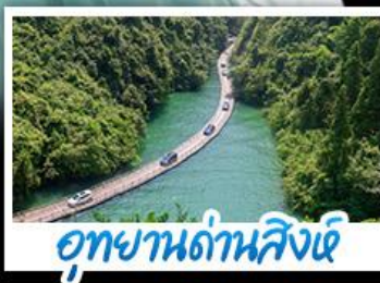
อุทยานด้านสิงห์