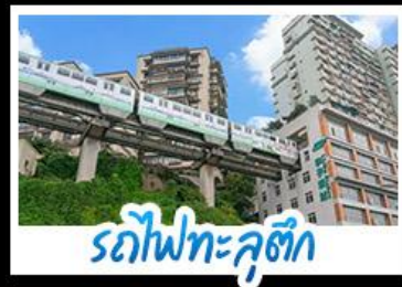
รถไฟทะเลสาบ

แกรนด์แคนยอนผิงซาน หมู่บ้านโบราณฉือซีไชว รถไฟทะเลสาบ หงหยาดัง อุทยานด้านสิงห์ นั่งรถไฟความเร็วสูง