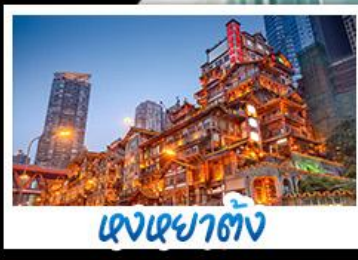
แดงเขยาดัง