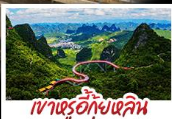
เขาตรู้อีกุ้ยหลิน