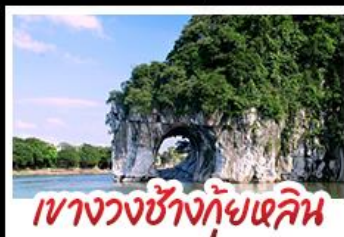
เขาวงกตช้างกุ้ยหลิน

ห้องเรือแม่น้ำลี่เจียง สวนสตรอว์เบอร์รี่ ทัศนียภาพสุดยอก นั่งบอลูนชมวิว 360 องศา ทางวงช้างกุ้ยหลิน กำฝู้อ้อ ฟ้ารุ้อี้ เมืองกุ้ยหลิน รถไฟความเร็วสูง พักโรงแรมระดับ 5 ดาว เมบูอาหารพิเศษ POP MART