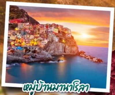
หมู่บ้านมานาโรคา