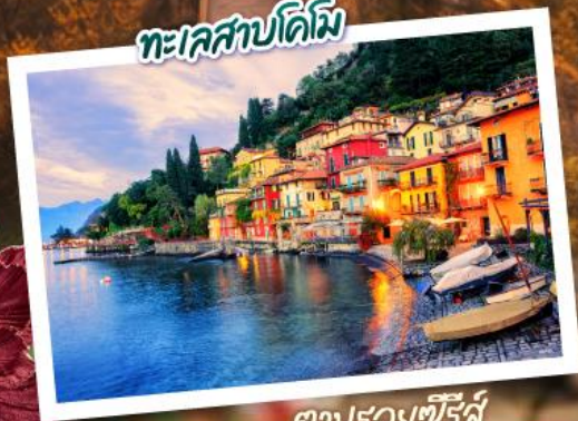
ตามรอยซีรีส์