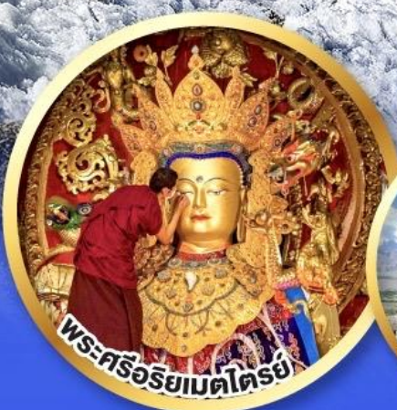
พระศรีอริยเมตไตรย์