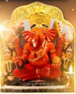
องค์สิทธีวินายก