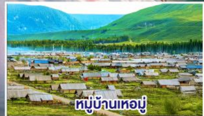
หมู่บ้านห่อมู่