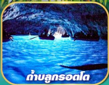
ถ้ำบลูกรอตโต