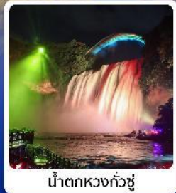
น้ำตกหวงกั๋วซู่