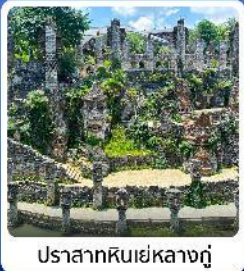
ปราสาทหินเย่หลางกู่

● โฮลท์ น้ำตกหวงกั๋วซู่ น้ำตกที่ใหญ่ที่สุดของจีน แหล่งท่องเที่ยวระดับ 5A ชมความสวยงาม หมู่บ้านเว่เจียงจ้าย หมู่บ้านจีนโบราณ