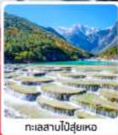
ทะเลสาบโป๋สุ่ยเหอ