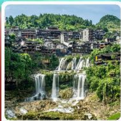
ฟูหลงเจิน

• ไฮโลว์ อุทยานเทียนเหมินซาน ชมประตูสวรรค์ หุบเขาหวาดาร หมู่บ้านโบราณฟูหลงเจิน และพิพิธภัณฑ์ ล่องเรือทะเลสาบเป่าเฟิงหู