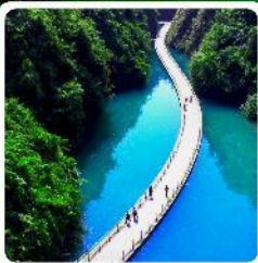
หุบเขาสิงโต