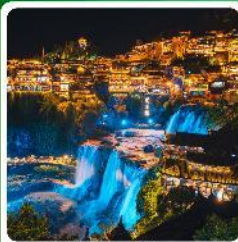
ฟูรงเจิน