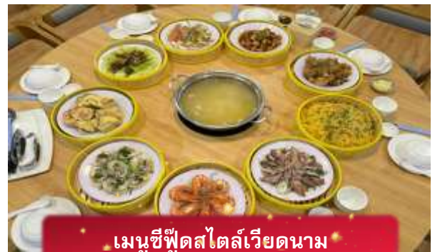
เมนูซีฟู้ดสไตล์เวียดนาม

17.05 เดินทางถึง สนามบินสุวรรณภูมิ โดยสวัสดิภาพ ... พร้อมความประทับใจ