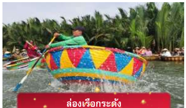
ล่องเรือกระดิ่ง

เช้า บริการอาหารเช้า ณ ห้องอาหารของโรงแรม นำท่านเดินทางสู่ หมู่บ้านกัมทาน เพื่อนำท่าน ล่องเรือกระดิ่ง หมู่บ้าน เล็กๆในเมืองฮอยอันตั้งอยู่ในสวนมะพร้าวริมแม่น้ำ ในอดีตช่วงสงคราม หมู่บ้านแห่งนี้เคยเป็นที่พักอาศัยของทหาร อาชีพหลักของคนที่นี่หมู่บ้านแห่ง นี้คือประมง ระหว่างการล่องเรือท่านจะได้ชมวัฒนธรรมของชาวบ้าน ณ หมู่บ้านแห่งนี้ สามารถให้ทิปได้ตามความพอใจของท่าน จากนั้นนำท่านเดินทางสู่ เมืองโบราณฮอยอัน เมืองมรดกโลกที่ยังคง เอกลักษณ์และรักษาวัฒนธรรมไว้อย่างดีเยี่ยม โดยท่านสามารถเดินเล่น ถ่ายรูป ตามตรอกซอกซอยต่างๆ ได้ ไฮไลท์ของการมา ถ่ายรูปเช็คอินที่นี้คือการได้ขึ้นไปถ่ายรูปจากมุมสูงของคาเฟ่ที่อยู่ตามซอกซอย ได้ทั้งวิว ได้ทั้งชิมกาแฟรสชาติออริจินัลของเวียดนาม