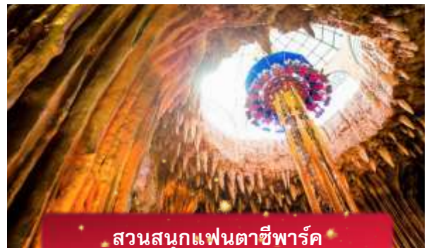
สวนสนุกแฟนตาซีพาร์ค

อิสระท่านท่องเที่ยว สวนสนุกแฟนตาซีพาร์ค ซึ่งมีเครื่องเล่นหลากหลายรูปแบบ เช่น ทำความผจญภัยของหนัง 4D ระทึกขวัญกับบ้านผีสิง เกมส์สนุกๆ เครื่องเล่นเบาๆ รถบั้ง หรือจะเลือกซื้อป๊อปซิ่งของที่ระลึกของสวนสนุก และ จัตุรัสแห่งดวงดาว เปรียบเสมือนการเดินทางสู่อาณาจักรแห่งดวงดาว ที่มีเส้นทางเชื่อมต่อระหว่างอาณาจักรแห่งดวงจันทร์และอาณาจักรแห่งดวงอาทิตย์ถนนที่แสนงดงาม และสถาปัตยกรรมที่ล้ำสมัยจุดเด่นของที่แห่งนี้ก็คือกระจกใสทรงสามเหลี่ยมที่ดูคล้ายกับพิพิธภัณฑลู่ฟวร์ที่ฝรั่งเศส ให้ความรู้สึกละลานตาเหมือนท่านกำลังท่องอยู่ในโลกแห่งเวทมนต์และดวงดาว (ไม่รวมค่าเข้าชมหุ่นขี้ผึ้ง)