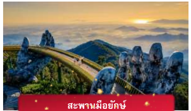
สะพานมอญักษ์

นำท่านชม สะพานมอญักษ์ แหล่งท่องเที่ยวใหม่ล่าสุดซึ่งอยู่บนเขาบานาฮิลล์ เป็นสะพานสีทองทอดยาวโดยมีมือ 2 ข้างอุ้มไว้ ตั้งอยู่ในตำแหน่งที่โดดเด่นเห็นชัด สวยงาม นำท่านชม สวนดอกไม้แห่งความรัก เป็นสวนดอกไม้สไตล์ฝรั่งเศส ที่มีดอกไม้หลากหลายพันธุ์ถูกจัดเป็นสัดส่วนอย่างสวยงามท่ามกลางอากาศที่แสนเย็นสบาย นำท่านชม สักการะพระพุทธรูปหินอึ้ง เป็นพระพุทธรูปหินองค์ใหญ่ตั้งตระหง่านบนยอดเขาแห่งนี้ ให้ท่านได้ขอพรเพื่อความเป็นมงคล นำท่านชม ป๊อปมาร์ท เป็นร้านค้าของเล่นเปิดใหม่ล่าสุดที่อยู่บนยอดเขาบานาฮิลล์ มีสินค้าของเล่นสำหรับนักจุ่มมากมายให้ท่านได้เลือกชมกับตัวละครน่ารัก อาทิเช่น Molly, SkullPanda, Labubu หมายเหตุ: การจัดการ และข้อกำหนดในการเข้าชมสินค้าอยู่นอกเหนือการจัดการของบริษัททัวร์