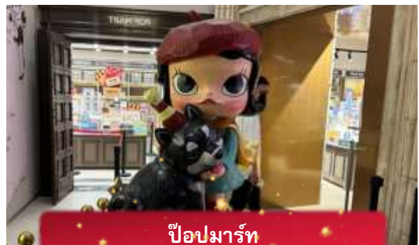
ป๊อปมาร์ท