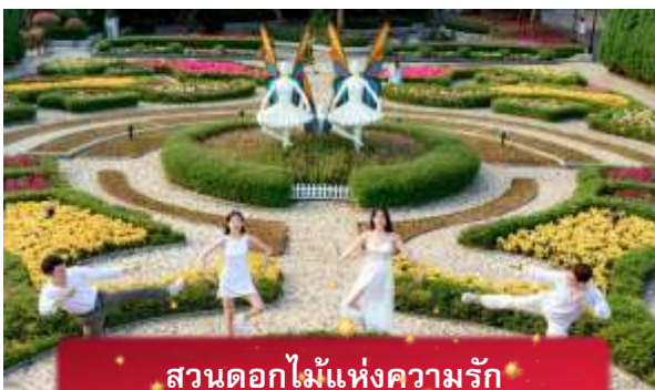
สวนดอกไม้แห่งความรัก