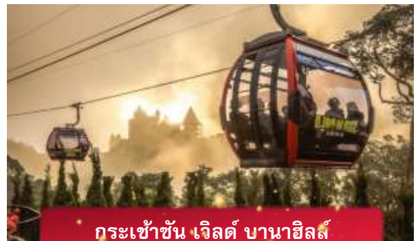
กระเช้าขึ้น เวิลด์ บานาฮิลล์

เที่ยง อีสรอาหารกลางวันเพื่อความสะดวกในการท่องเที่ยว