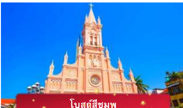
โบสถ์สีชมพู

ค่ำ บริการอาหารค่ำ ณ ภัตตาคาร พิเศษ ... เมนูบุฟเฟ่ต์ปิ้งย่าง ที่พัก MAGNOLIA HOTEL เทียบเท่าหรือระดับ 4 ดาวท้องถิ่น