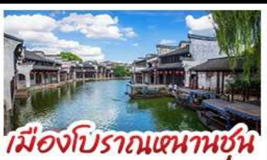
เมืองโบราณหนานชุน

DISNEYLAND SHANGHAI เต็มวัน เมืองโบราณหนานชุน (รวมล่องเรือ) - วัดจิ่งอัน เมืองโบราณหนานชุน - ตลาดร้อยปีฉางหวังเมี่ยว มือพิเศษ บุฟเฟ่ต์ BBQ, เสี่ยวหลงเปา