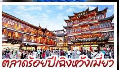
ตลาดร้อยปีฉางหวังเมี่ยว