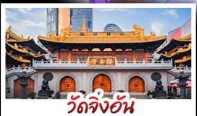
วัดจิ่งอัน