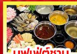
บุฟเฟ่ต์ซาบู