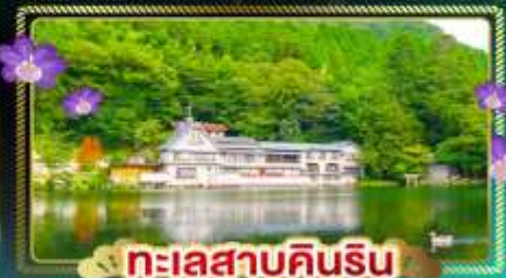
ทะเลสาบคินริน