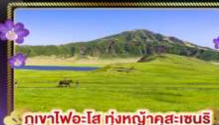
ภูเขาไฟอะโฮะทุ่งหญ้าคุสะเซนริ