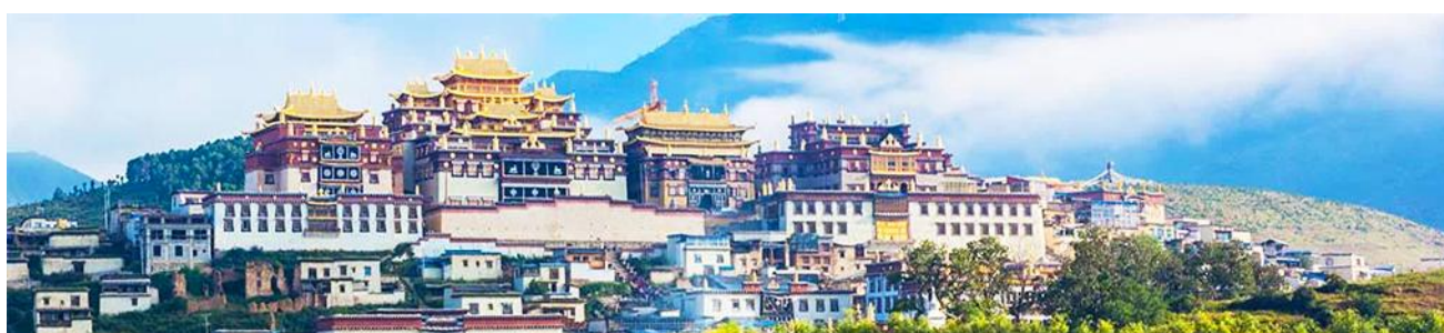
เมืองโบราณเซงกรีล่า