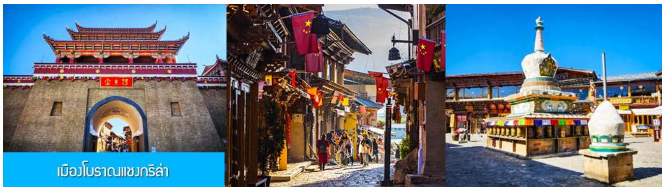
เมืองโบราณเซงกรีล่า