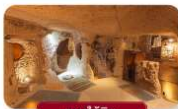
นครใต้ดิน