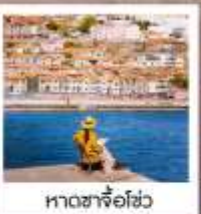
หาดซาโจ่วฮั่ว

เรือลู่กั๋ว / ย่านฉินเหล่งฟาง / สวนเว่ยไห่ / WEI HAI WINDOW / ถนนฮวงจวิ๋น สวนหย่อมโกทอน / เมืองท่าฮั่วฉิงไห่ / หอคอยตาคองคา / ชายหาดจินซา / รูปปั้นปลาฉลาม แปดเซียนข้ามถนน / หาดทรายซาโจ่วฮั่ว / หาดไซเบอร์ NO.3 / สวนจงซาน / ถนนหลงเจียง พิพิธภัณฑ์ที่ว่าการท่าเรือ / Silver Fish St. / สะพานจินเจียว / โบสถ์ St. Emil ถนนเป่าฉ่าทวน / ห้างเว่ยซานไห่เจียม NIGHT MARKET / QINGDAO HAITIAN CENTER ชั้นB1 โรงงานเบียร์ชิงเต่า / ถนนเลียบชายหาดปิ่นไห่ปูฉ่า / ถนนคนเดินไถ่ตง