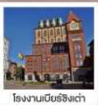
โรงงานเบียร์ชิงเต่า