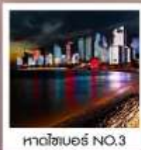
หาดไซเบอร์ NO.3

ซิมฟรี!! ...เบียร์ชิงเต่า สูตรออริจินัลดั้งเดิม ...ท่านละ 1 แก้ว