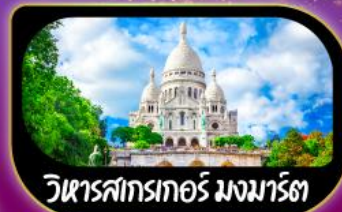
วิหารสกรเทอร์ มงมาร์ต