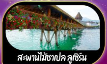
สะพานไม้ชาเปล คูซีน